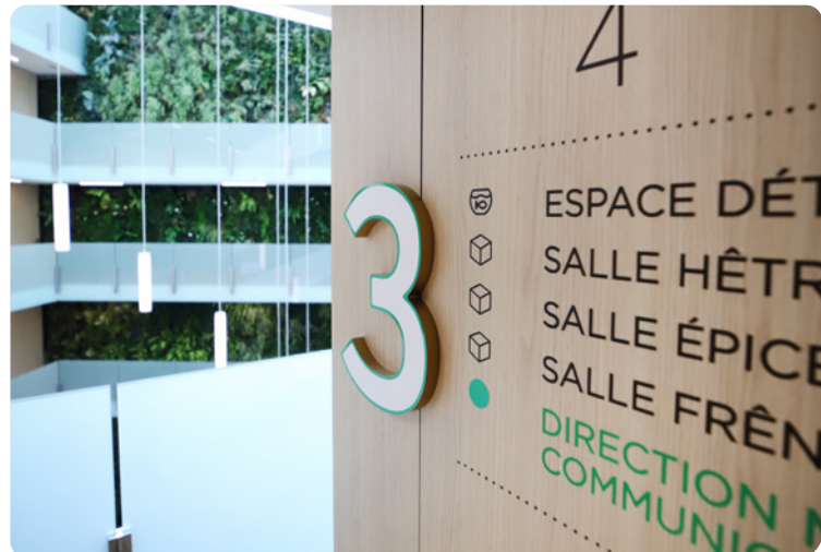
Crédit agricole de Franche-Comté - La banque nous a sollicité pour réaliser la signalétique intérieure de son siège régional à Besançon, sur sept étages. Une attention particulière a été portée à l'ascenseur, équipement pour lequel les indications doivent être claires et compréhensibles.