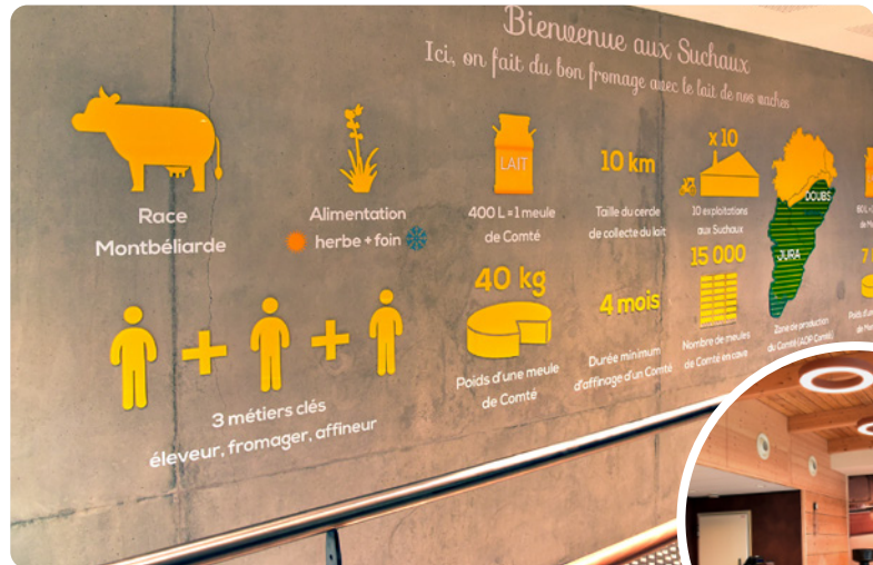
Fruitière des Suchaux - Nous avons travaillé au guidage des clients/visiteurs de cette institution du fromage dans le Haut-Doubs. Un projet qui traduit notre fort ancrage local.