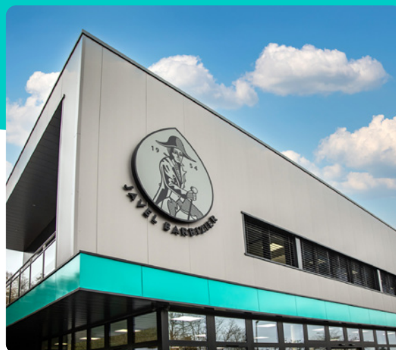
Un projet d'envergure regroupant enseignes lumineuses, design d'intérieur, marquage de véhicules...