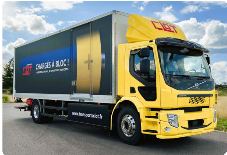
Transports Clot - Nous avons marqué les faces latérales de la caisse d'un camion électrique. Les spécificités de ce chantier : les dimensions de la surface à couvrir et la technicité requise pour la partie cabine. Cette dernière a nécessité la pose d'adhésif et une étape de peinture.