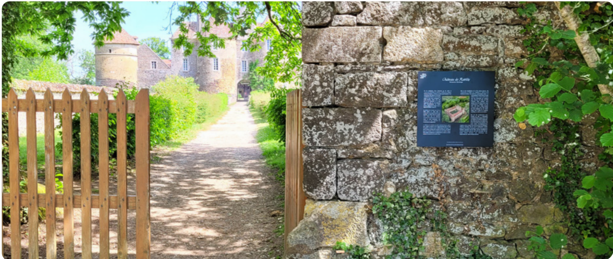
Région Bourgogne Franche-Comté - En réponse à un marché public, nous avons réalisé une centaine de plaques de mise en valeur du patrimoine régional, selon un cahier des charges précis. Ces petits panneaux accompagnent des sites et monuments de toute la région, comme le château de Ratilly, dans l'Yonne.