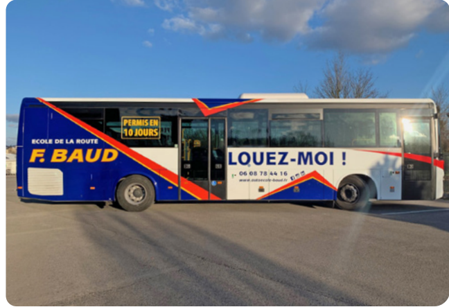
Bus F.Baud - Ce covering intégral d'envergure a demandé une semaine complète de travail pour deux poseurs. Nous avons adapté notre atelier pour y faire rentrer ce bus de 17 m de long.