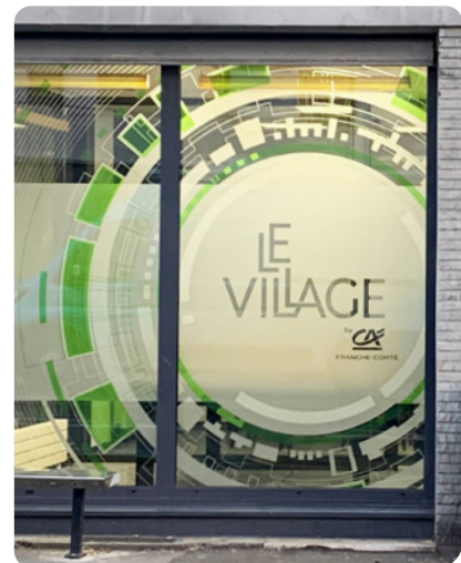
Le Village by Crédit agricole - Nous avons décoré les murs des espaces de travail de cet incubateur de startups. Objectif : mettre de la couleur dans le quotidien des entreprises incubées.