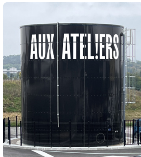
Aux Ateliers - Deux défis techniques pour ce chantier global : une hauteur exceptionnelle de lettres - 2 m - pour l'enseigne et un habillage vinyle à poser, perchés sur une nacelle, sur une cuve vue depuis la N57.