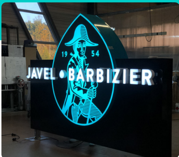
Toutes nos enseignes lumineuses sont testées en atelier avant d'être livrées et installées par notre équipe de pose.