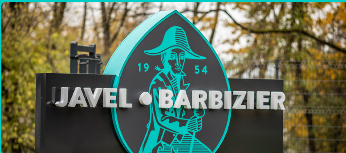
Javel Barbizier - Ce totem horizontal scellé au sol, commande assez rare et pièce d'un projet global, constitue un vrai travail de création à partir de l'identité visuelle du client.