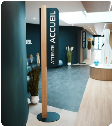
CIMRAD - L'ancien bowling de Thise a été réhabilité en locaux médicaux. Nous sommes intervenus sur la signalétique murale et le marquage des vitres. Tel un hommage au lieu, la quille du bowling a été conservée.