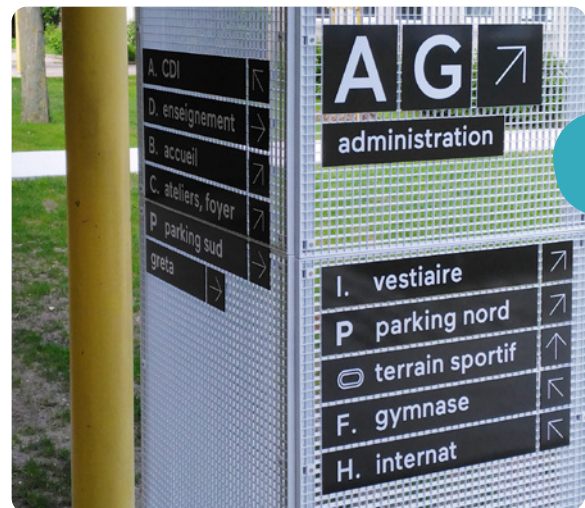
Lycée Voillaume - Nous sommes intervenus dans le cadre de la réhabilitation de cet établissement scolaire d'Aulnay-sous-Bois (région parisienne). Nous avons réalisé toute les signalétiques intérieure et extérieure, fixée notamment sur des caillebotis métalliques.