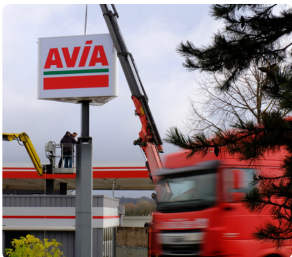
Avia - Ce totem aérien rétroéclairé (dans la zone commerciale Valentin en périphérie de Besançon) avait la particularité de devoir être vu de partout, d'où sa structure à trois faces, peu commune.