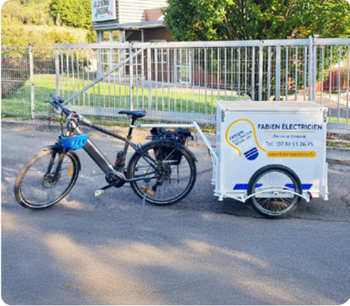
Fabien électricien - Encore un projet atypique ! Nous avons couvert la remorque de cet électricien qui intervient en triporteur.