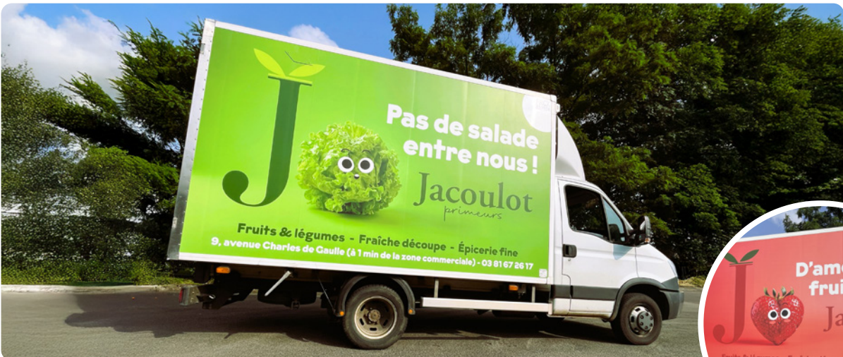
Jacoulot - Le primeur de Morteau souhaitait utiliser son camion frigorifique comme un panneau 4x3 roulant ! Nous en avons donc marqué les deux faces en reprenant, bien sûr, l'identité visuelle et la communication de l'entreprise.